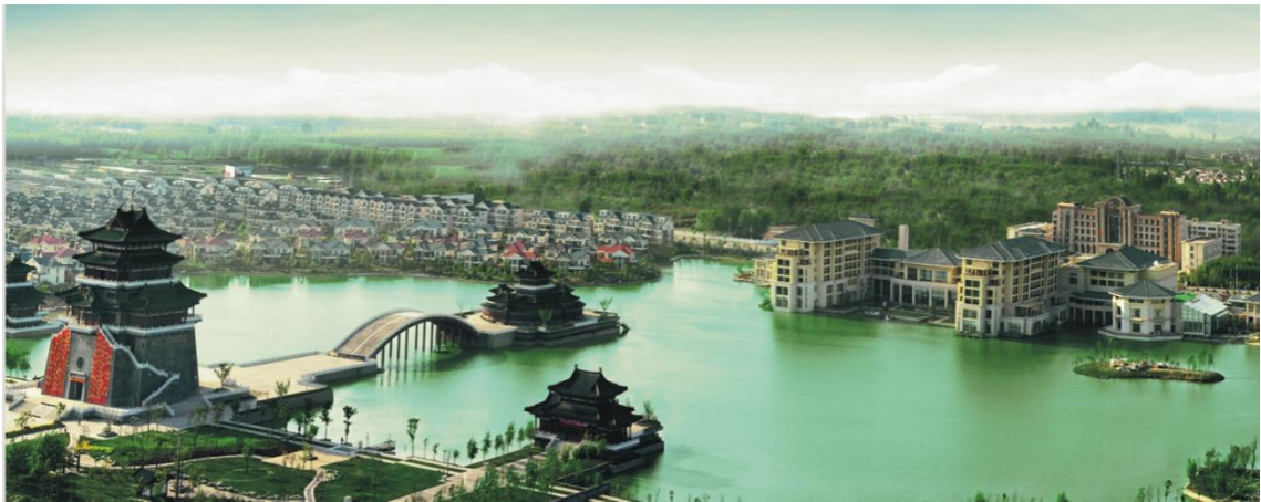
图 1-1 开封开元名都大酒店全景图

开封开元名都大酒店是由位列最具规模中国饭店集团第二名的开元旅业集团在中原投资并管理的首家五星级度假酒店。酒店地处开封市省级高新技术园区——开封新区，地理位置优越，环境优美，所在西区是开封新的政治、经济、文化中心。酒店建于300亩金明池水中央，总建筑面积54000平方米。酒店曾先后荣获“亚洲酒店业金橄榄奖-中国十大最受欢迎首选度假品牌酒店”、“中国星光奖-中国最佳设计精品酒店”和“金枕头奖-最佳温泉度假酒店”，并于2012年荣获“第二届中国饭店金星奖”，是开封目前最具标志性的建筑之一。