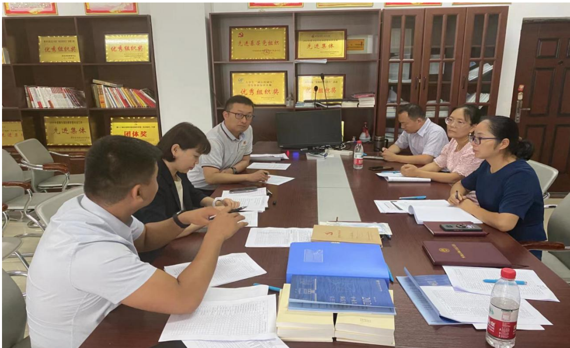
图 4-3 校企共同研讨现代学徒制人才培养方案