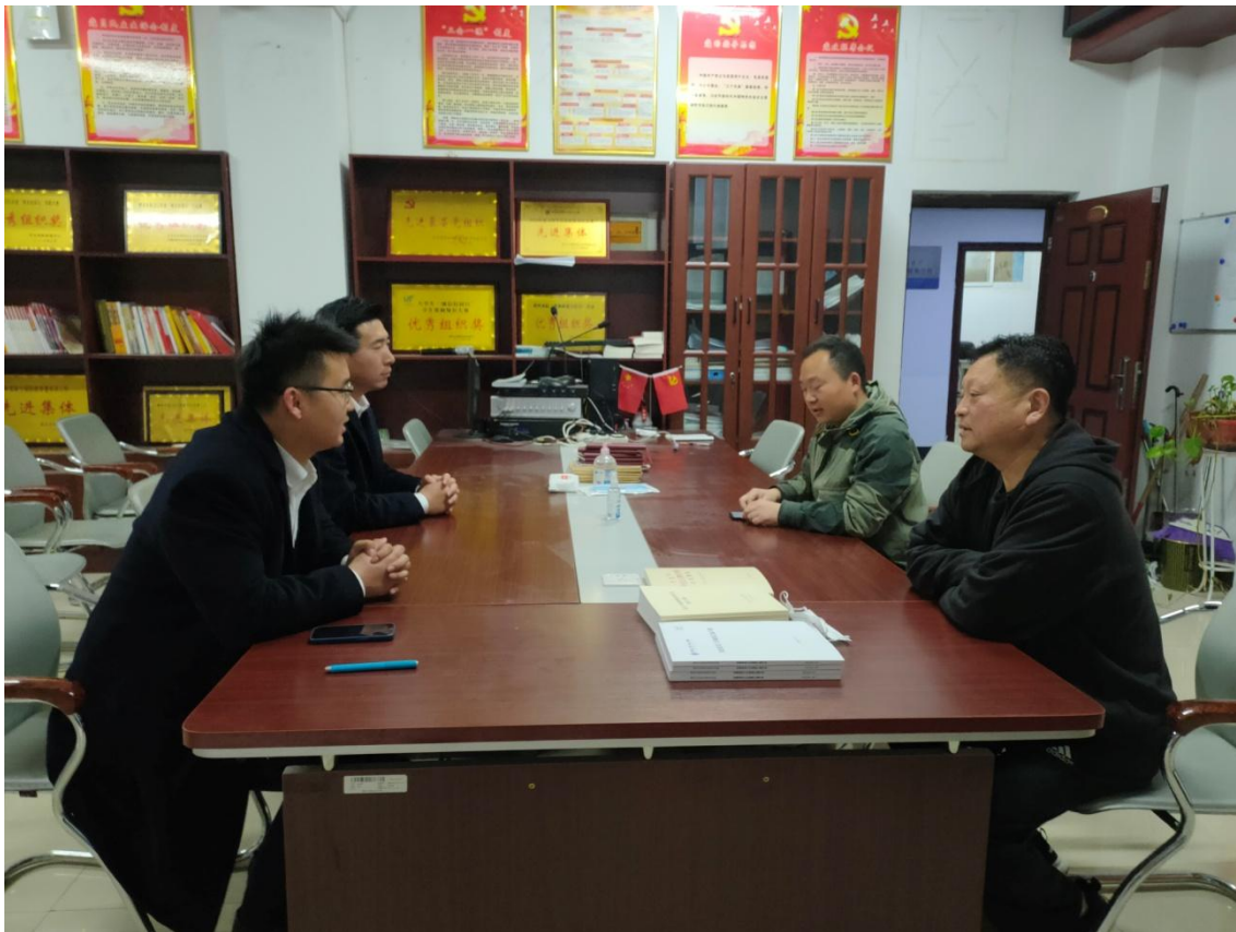
图 2-1 与开元酒店集团现代学徒制探讨