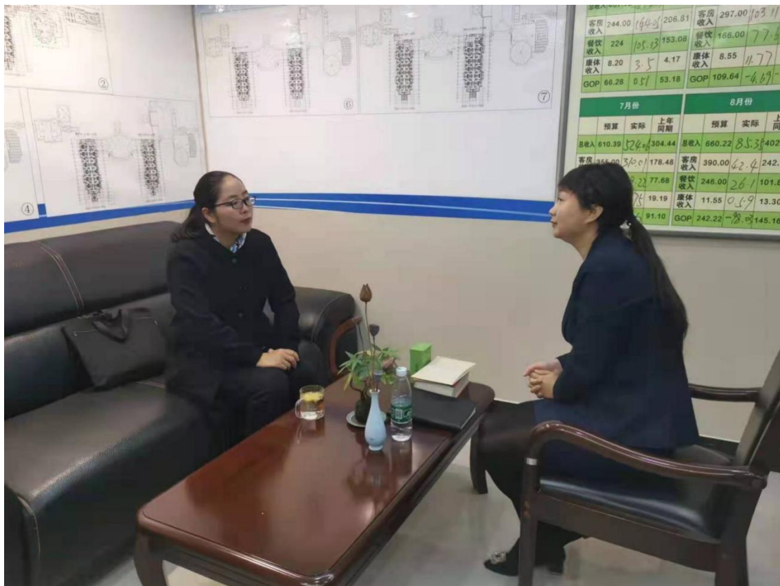
图 5-1 为开元名都大酒店制作营销策划方案探讨