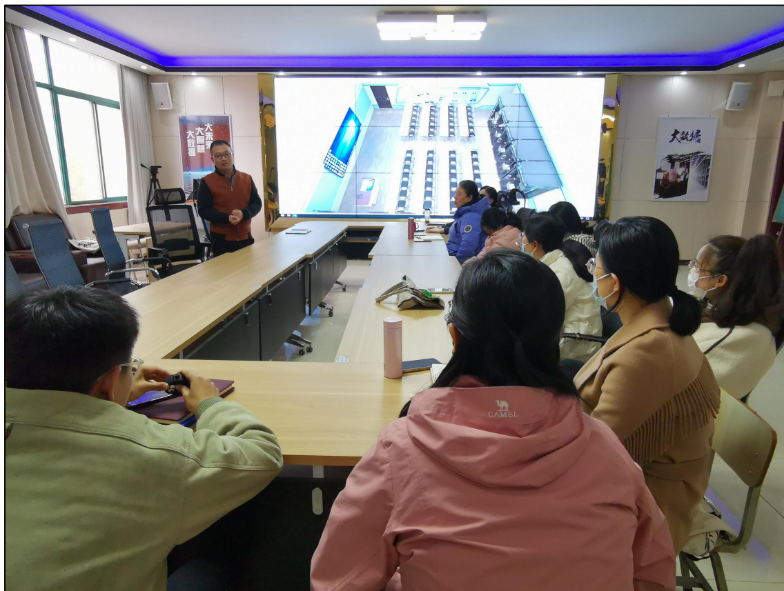
图 4-5 教材建设专题研讨会

与企业专业人员合作探讨教材建设，结合实际案例和企业经验，使教材更与时俱进，更贴近实际应用。同时，高校鼓励教师参与企业培训，了解最新行业动态，有效提升教师专业水平。