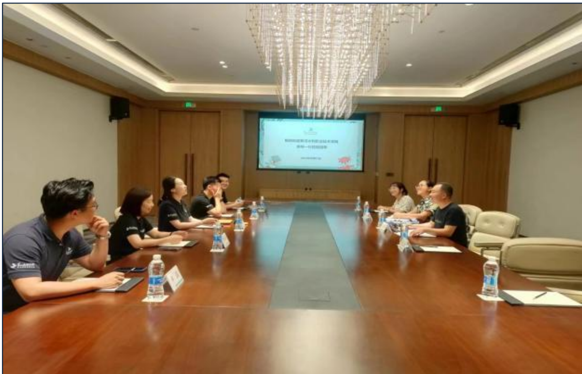
图 4-4 实训基地建设研讨

与企业共同投资建设实训基地，模拟真实工作场景，配备先进的设备和技术，为学生提供实际操作和解决问题的机会。基地还与企业密切合作，提供就业或实习机会，为学生建立起与企业密切的联系。