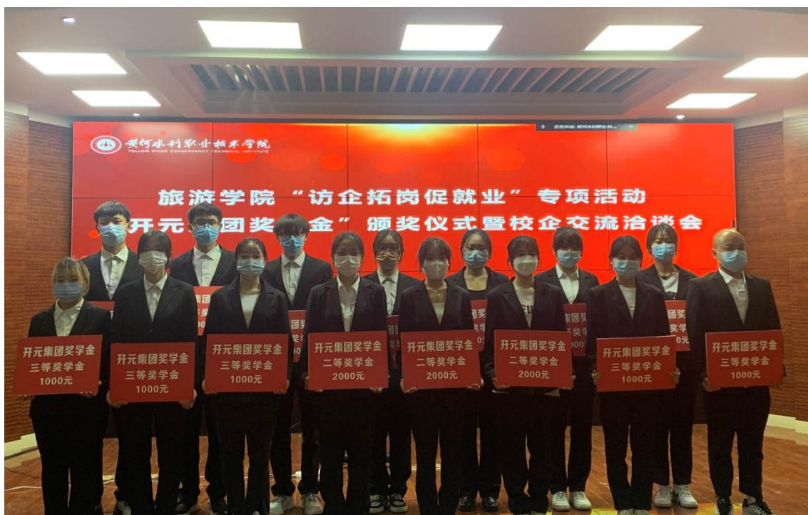
图 3-1 “开元集团现代学徒制试点班”奖学金颁发仪式

“开元集团现代学徒制试点班”的学生每年设立奖学金3个，每个奖学金3000元。企业为“开元集团现代学徒制试点班”的学生每年设立助学金3个，每个助学金1000元。来自酒店管理专业的15名学生获得奖学金，获奖学生感言“在开元集团奖助学金的鼓励下，学习动力和责任意识都提高了。现在我们是受益者，今后我们要成为奉献者，将来回报开元集团，回报社会。”